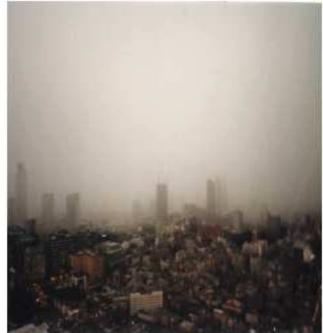
Figura 2: Uma tempestade se aproximando de uma cidade. Compare o tamanho do conjunto formado por núvens e chuva com o tamanho dos prédios.

dos necessários para produzir-se tal efeito físico. Imaginemos, agora, que para influenciar uma tempestade inteira seria preciso atuar em mais de 1 trilhão de litros de uma mistura de ar, vapor de água e água líquida. Quantos médiuns seriam necessários para produzir-se um efeito, mesmo que pequenino, em todo este volume? Imaginemos, ainda, que uma tempestade pode estar ocorrendo em milhares de cidades espalhadas pelo mundo ao mesmo tempo. Lembremos também que para afastar uma tempestade, por exemplo, é preciso não só atuar na região onde ela ocorre mas, nas regiões vizinhas pois elas podem estar enviando frentes frias ou úmidas ou algo do tipo, e é preciso, portanto, atuar nestas regiões também. A figura 2 abaixo nos dá uma idéia da ordem de grandeza de um fenômeno de uma tempestade.