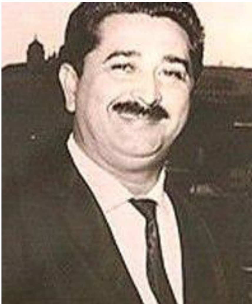
José Pedro de Freitas (Zé Arigó)