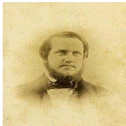
Dom Pedro II aos 24 anos de idade, 1850.