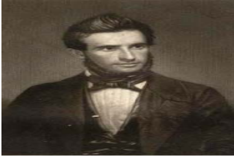
Foto aos 21 anos