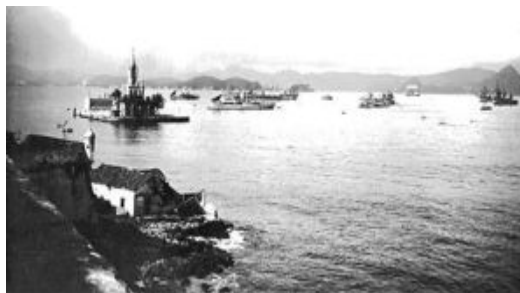
Fotografia da Baía da Guanabara de Marc Ferrez – fotógrafo franco-brasileiro

Há fotos da floresta da Tijuca, da praia de Botafogo, do Jardim Botânico do Rio de Janeiro, da ilha das Cobras, focadas nas imagens urbanas de uma cidade que começava a se expandir, num período anterior à reurbanização empreendida pelo prefeito Francisco Pereira Passos, no início do século XX.