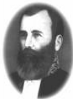
Bezerra de Menezes

Após a Proclamação da República em 1889, surge o novo Código Penal (1890) no qual o ESPIRITISMO era enquadrado como " transgressão à lei, em alguns de seus dispositivos dúbios".