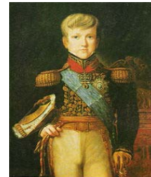
Dom Pedro II aos 12 anos de idade, 1838.

Durante seu reinado, foi aberta a primeira estrada de rodagem, a União e Indústria ; correu a primeira locomotiva a vapor; foi instalado o cabo submarino; inaugurado o telefone e instituído o selo postal .