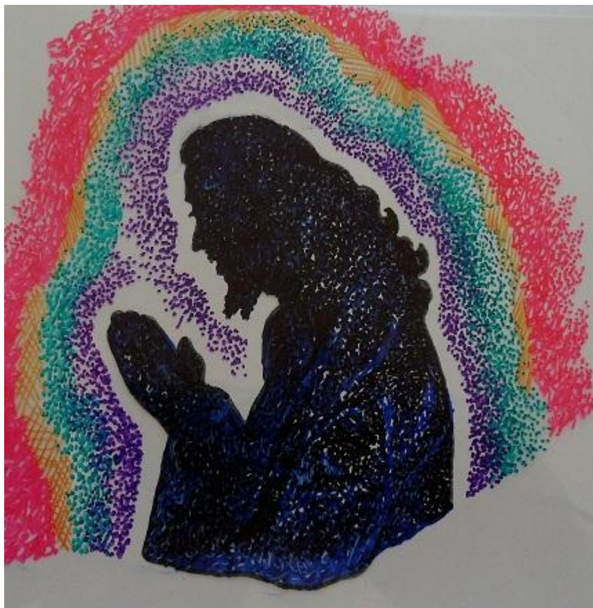
o Consolador prometido (Mozart Cataldi do Couto)