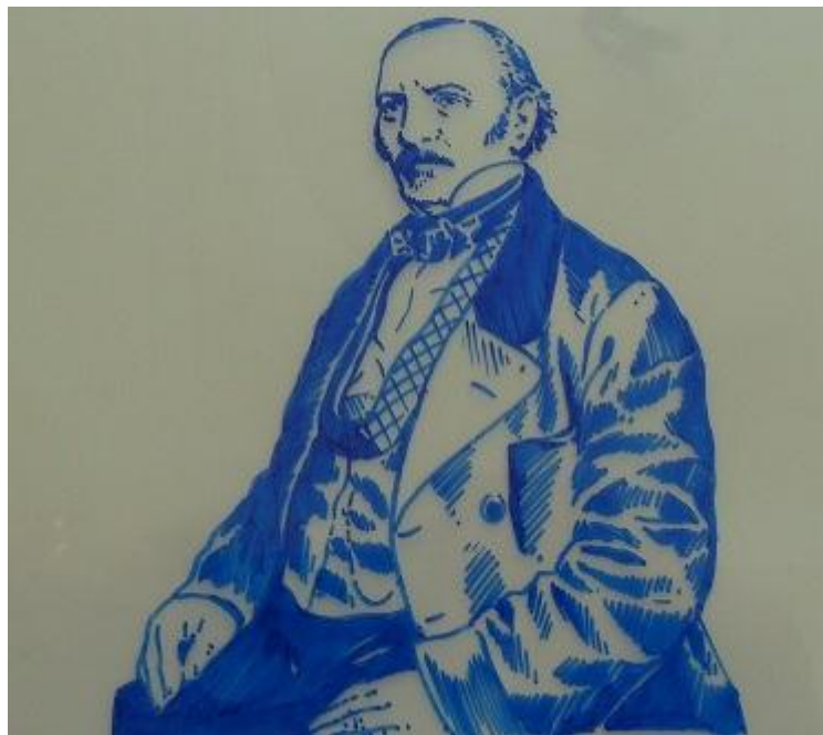
Allan Kardec idoso (Mozart Cataldi do Couto)