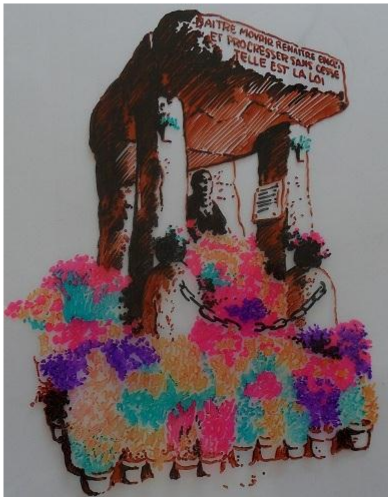
Dólmen de Allan Kardec (Mozart Cataldi do Couto)