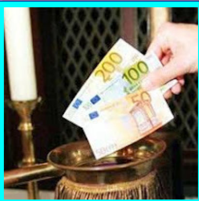
Espiritismo não gratuito

Testemunhamos uma prática doutrinária, aliás, bastante desigual do movimento espírita de algumas grandes cidades, onde são planejados eventos “espíritos” (congressos, seminários, encontros fraternos, simpósios) não gratuitos, não raro transformados em espetáculos de oratórias, em que se destacam mercadores ambulantes (mascates), que vendem suas palestras a preços “modestos” e as suas publicações literárias para supostas obras sociais, ou ainda, palestras musicais cujos artistas vendem CD’s e DVD’s ao final da apresentação.